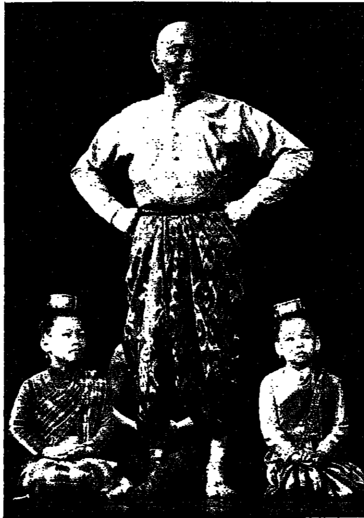
يول براينر أثناء بروفة لثوره ليلو، في واشنطن مؤخرا